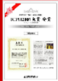
ポリフェノール学会大賞受賞