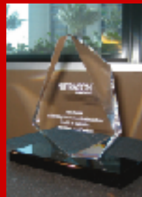
ニュートラコン賞

科学者、栄養士などの専門家達より選ばれたヘルス&ニュートリションとテクノロジー製品に毎年送られる「ニュートラコン会議」にて最優秀賞を受賞。その他、ポリフェノールの国際会議であるポリフェノール学会にて2007年度大賞を受賞。